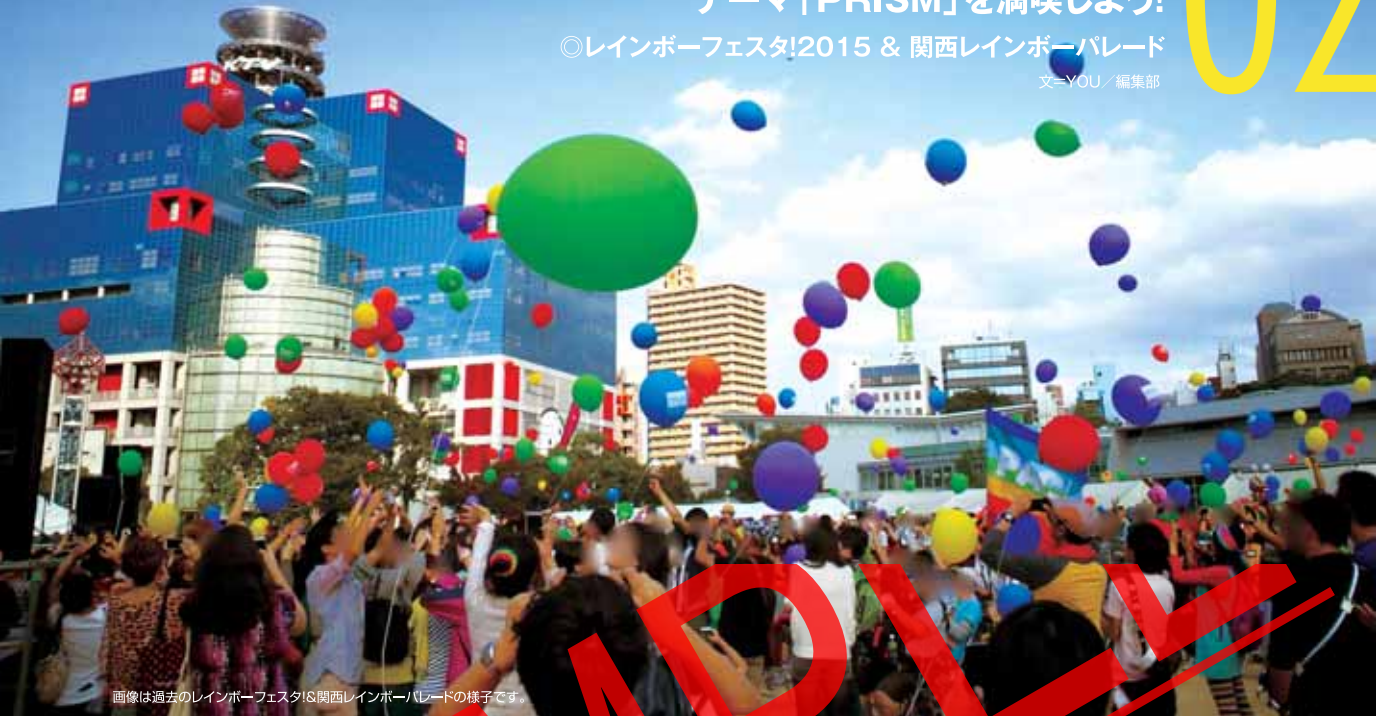
画像は過去のレインボーフェスタ!&関西レインボーパレードの様子です。