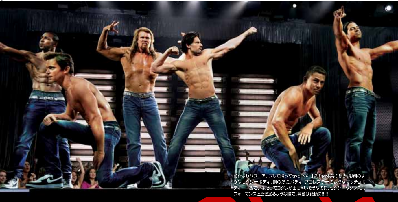
前作よりパワーアップして帰ってきた「XXL」級の肉体美の彼ら、彫刻のようなセクシーボディ、鋼の筋金ボディ、プロレスラーのようなマッチョボディ…観ているだけでヨダレが出ちゃいそうなのに、セクシーなダンスパフォーマンスと透き通るような瞳で、興奮は絶頂に!!!!