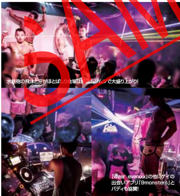
水鉄砲の飛沫と汗がほとばしり会場は熱気マンマンで大盛り上がり!